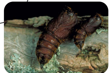
Juin - Juillet Pupes