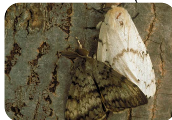
Juillet - Août Papillons adultes