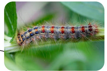
Avril - Juin Larves (chenilles)